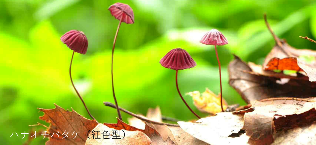
ハナオチバタケ（紅色型）