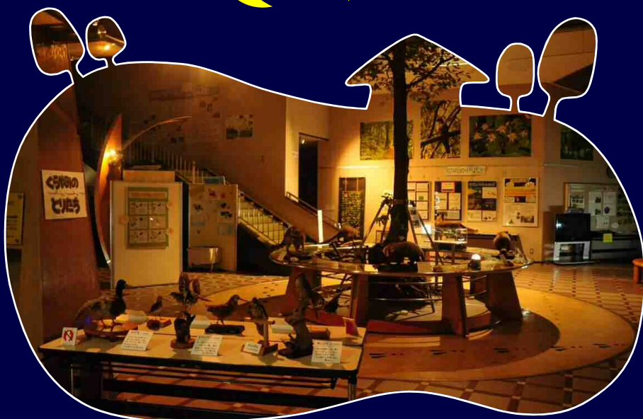
夏の夕暮れ観察会